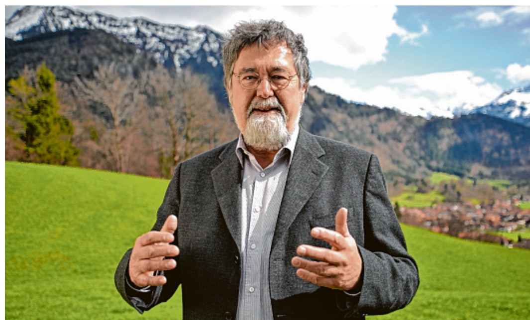
Wissenschaftler Werner Bätzing zeigt Wege auf, wie die Alpen dezentraler Lebens- und Wirtschaftsraum bleiben können. Sein Ansatz: Multifunktionale Nutzungen statt Monostrukturen.

Bätzing ist ein Verfechter einer ausgewogenen „Doppelnutzung“ der vorhandenen Ressourcen einerseits in traditioneller Weise durch die ansässige Bevölkerung,