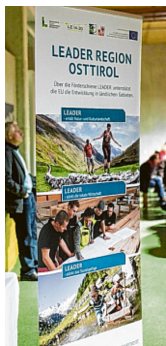
Leader-Fördermittel unterstützen Osttirols Weg zur Modellregion.

„Die Alpen sind ein junges Hochgebirge mit hohem Ödlandanteil. Erst der Mensch hat aus der Natur jene Kulturlandschaft geschaffen, die unser Alpenbild prägt. Seit dem Beginn der Industrialisierung und der damit verbundenen Verkehrerschließung lässt sich in den tiefen Becken- und Tallagen eine zunehmende Verstädterung beobachten, während der eigentliche Gebirgsraum flächenhaft als Lebens- und Wirtschaftsraum entwertet und – von punktförmigen, meist touristisch aufgewerteten Standorten abgesehen – entsiedelt wird“, erläuterte der Referent.